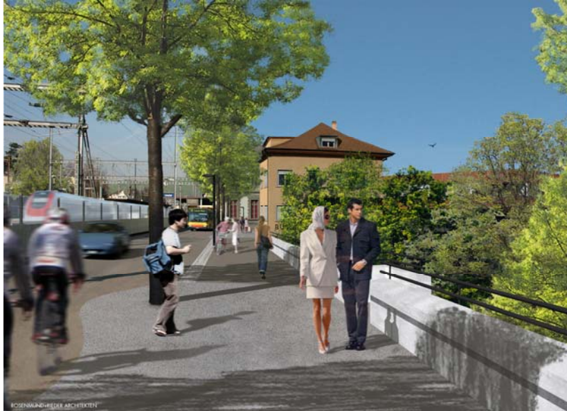
Fotomontage der korrigierten Poststrasse mit den Lärmschutzwänden aus Glas