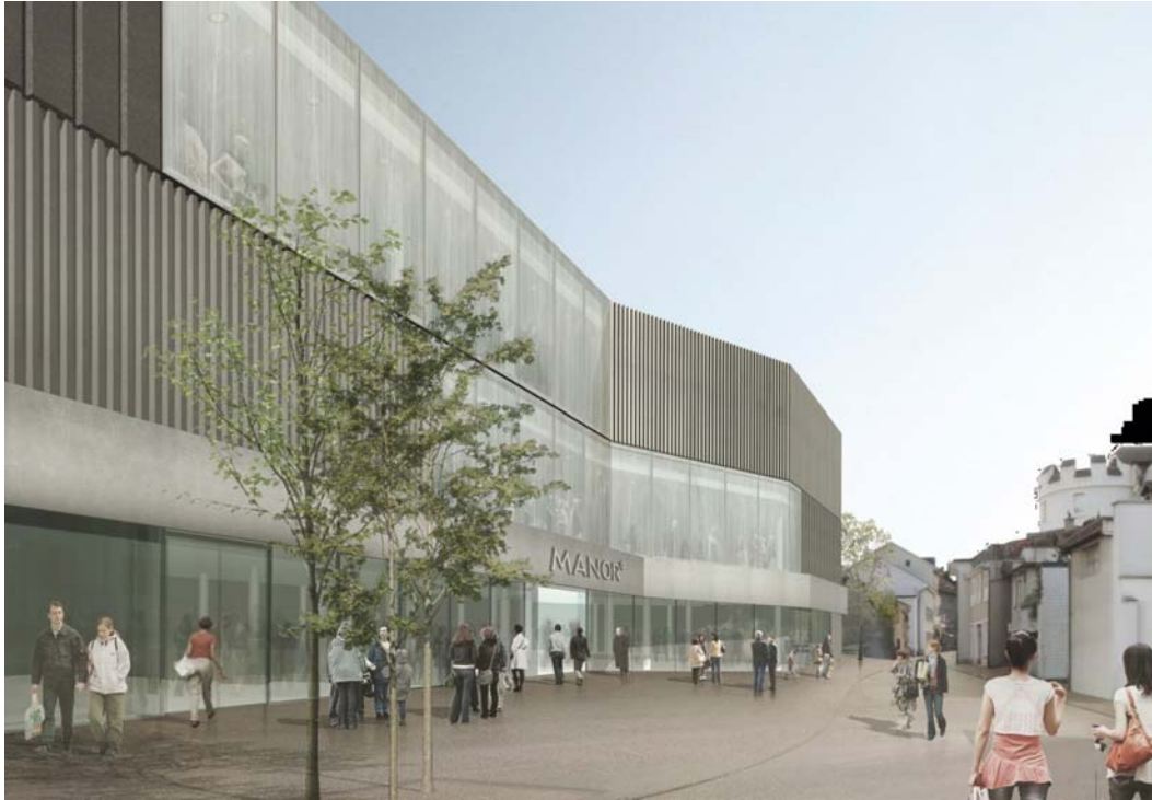
Visualisierung Eingangsbereich Warenhaus Manor und Bücheliplatz