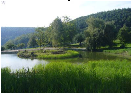
Weiher Bad Schauenburg – Zustand nach 6 Wochen

Als abschliessende Arbeiten für die Landschaftskommission werden im Jahre 2011 ein Pflegekonzept erstellt und eine Pflegevereinbarung abgeschlossen. Mit diesen Massnahmen wird erreicht, dass die diversen Pflanzen- und Tierarten im und um den Weiher auch in 20 Jahren noch vorhanden sein werden. Wie aus der separaten Dokumentation vom 25.11.10 ersichtlich ist, kann schon nach ein paar Wochen nach der Sanierung von einem Erfolg für die Zukunft ausgegangen werden.