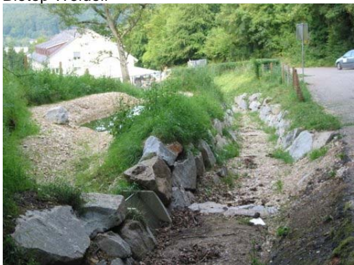
links Biotop / rechts Weidelibächli